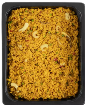
Paella Rijstmix Chorizo 3kg