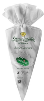
Stracciatella in spuitzak 250gr