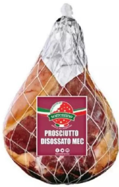
Italiaanse ham mec 6.5kg Week 24-25