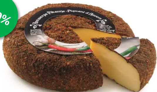
Antwerps Pikantje 2kg Week 25-26