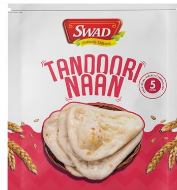
Tandoori Naan 426gr