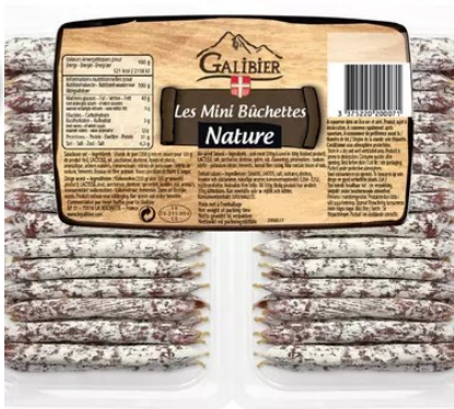
Mini Buchette Natuur/Hazelnoot/ geitenkaas 480gr