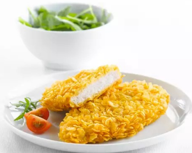
Krokante Kippenfilet 2kg