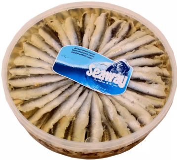
Ansjovis op olie 1kg