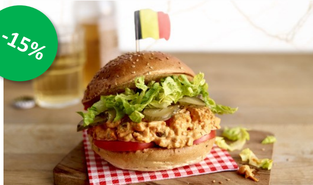
Wk Salade Hamal (bacon burger) 2kg Week 23-24