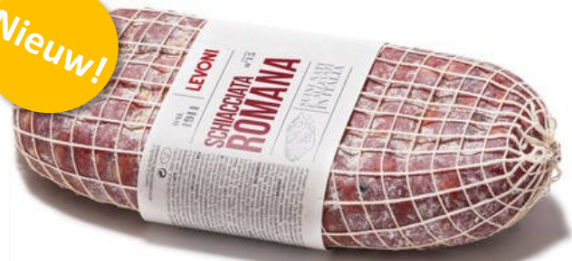
Schiacciata Romana 1,8kg