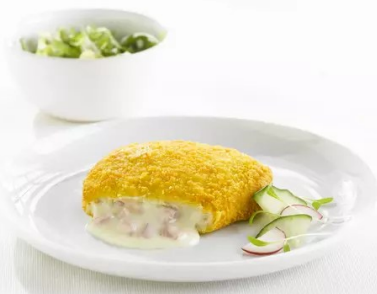
Gevulde kipfilet Ham kaas 2x8st