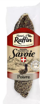
Pur porc met peper 10x200gr