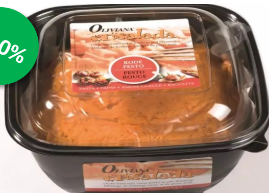
Oliviana ensalada rood 1,1kg Week 25-26