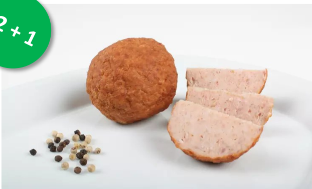
Boulettes de menage 15x120gr