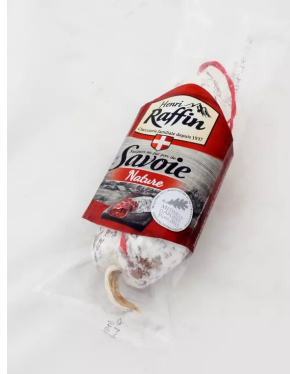
Pur porc de savoie 10x200gr