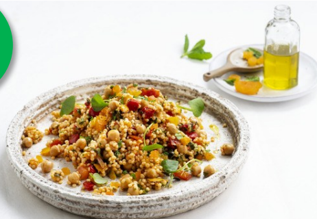
Parelcouscous mediterraan 1.25kg Week 25-26