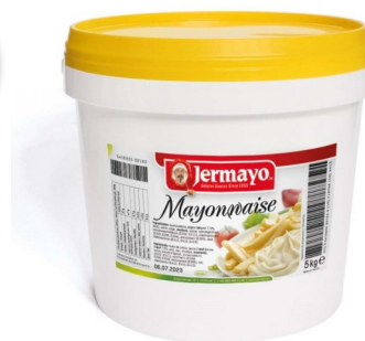
Mayonaise Jermayo 10kg Week 24-25