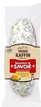
Pur porc met beaufort kaas 10x200gr