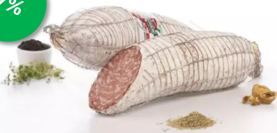
Sopressa al finocchio 1.3kg Week 23-24