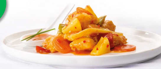
Zoetzure kip 3kg Week 25-26