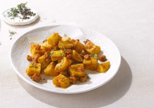
Patatas Bravas 2kg Week 23-26