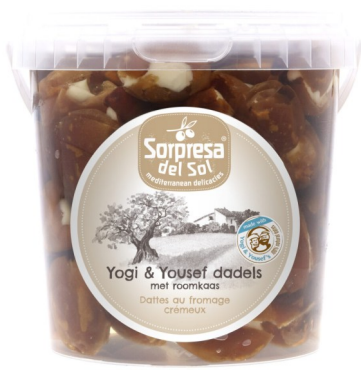
Dadels Y&Y Friese geitenkaas 875gr