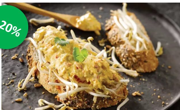
Thaise kip salade 1kg Cru's Week 23-24