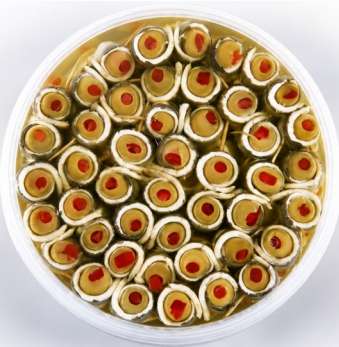
Ansjovis spiesjes 1kg