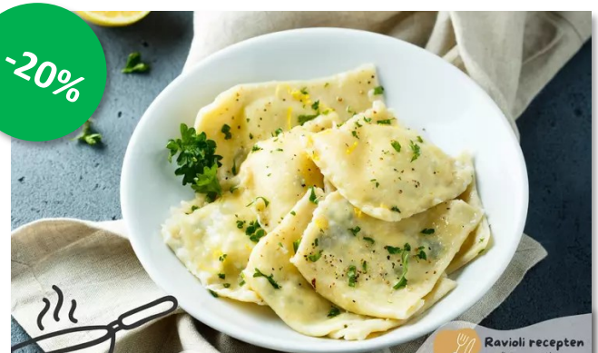
Ravioli Vierkant Groene asperges 1kg IQF