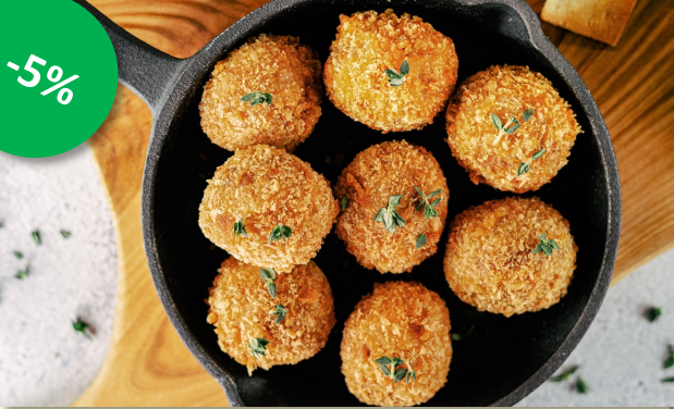
Rund draadjes bitterbal 42x30st

Juni 2026 Promofolder www.decru.be - bestellingen@decru.be