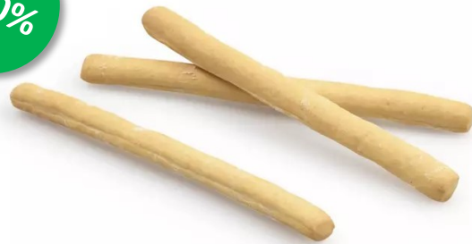
Grissini Artisaanaal Natuur 800gr