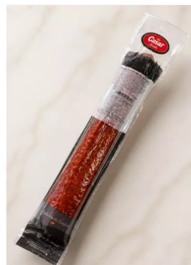
Chorizo Zacht 1,7kg Galar