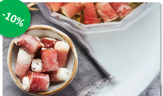
Mini batoens 500gr Week 23-24