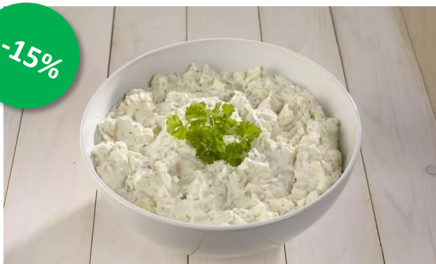
Aardappelsalade hamal 1kg Week 25-26