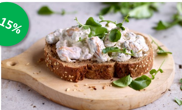
Mossel Tartaar 1kg Week 23-24