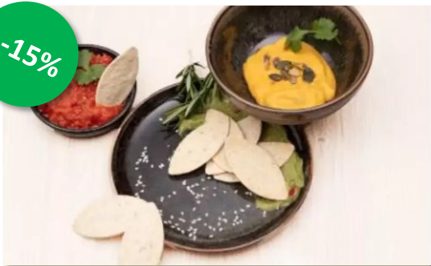
Apero Leaves Thyme 1kg DV