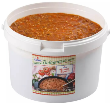
Bolognese saus 2,5kg Hamal