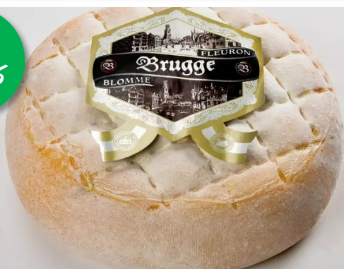
Brugse Blomme 2kg Week 27