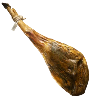
Iberico Ham Cebo met poot 36m