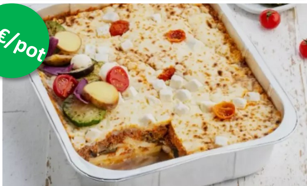
Moussaka 3.2kg pot Week 23-24