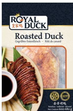
Geroosterde Eend 600-680gr Topkwaliteit!