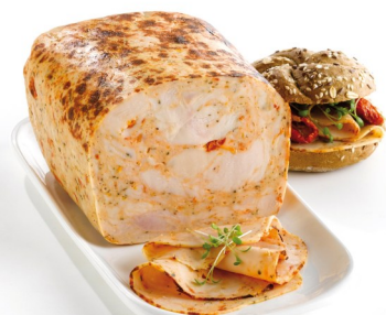
Kipfilet zongedroogde tomaten 1,7kg