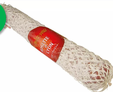
Rosette de Lyon 2kg Week 23-24