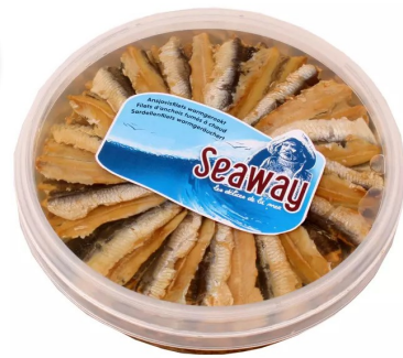
Warm Gerookte ansjovis 500gr