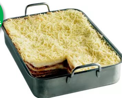
Lasagne vamos 5kg Week 25-26