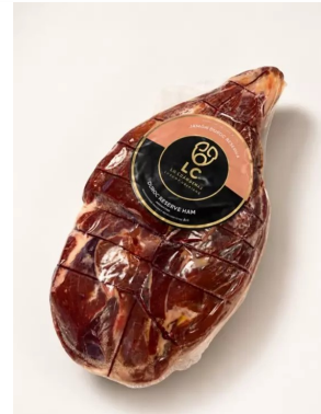
Duroc ham Reserva 14m 5kg Week 24-25