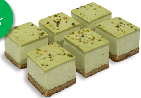
Pistache Component 4x4 - 8x3cm