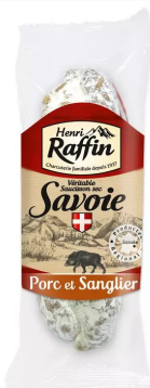
Pur porc met everzwijn 10x200gr