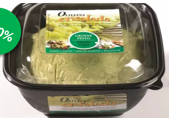
Oliviana ensalada groen 1,1kg Week 25-26