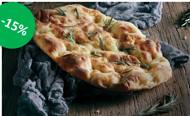
Pinsa 10x(2x230gr) Week 24-25