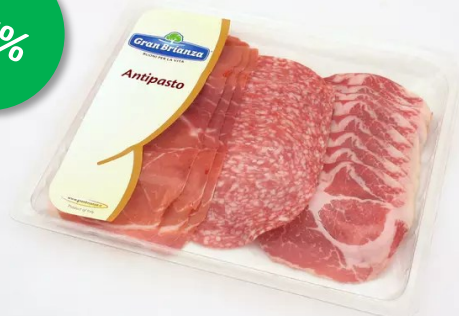
Antipasto (Italiaanse ham, Milano, Coppa) 150gr