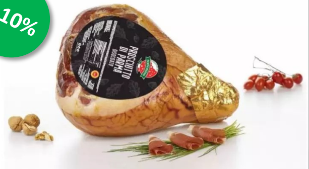
Parmaham 6.9kg 14 maand Week 24-25