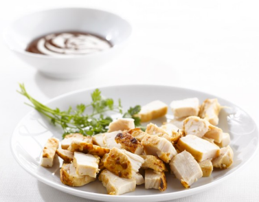
Ovengebakken Kippen reepjes 1kg