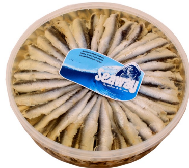
Ansjovis met look 1kg