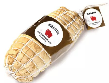
Cappocolo in carta 1,6kg