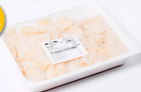
Parmesanschilfers 1kg Zapellon