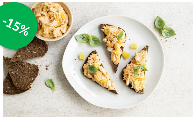
Kip hawaii salade jebo 1kg Week 23-24