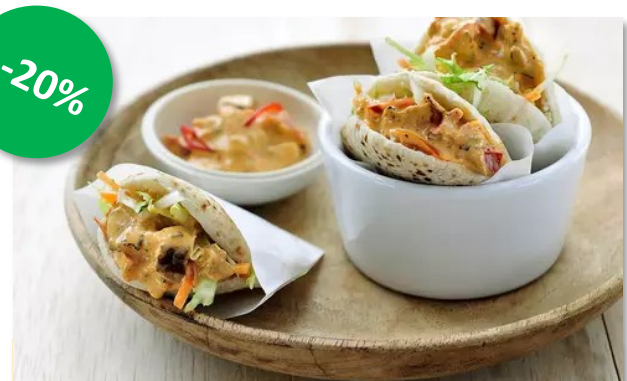
Pita pikant 1kg Cru's Week 25-26