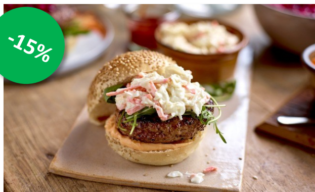
Coleslaw 1,5kg Week 25-26