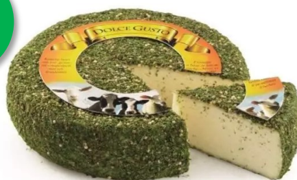
Dolce gusto 1.3kg Week 24