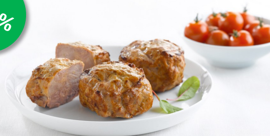
Pave Mignon 120-130gr/150-