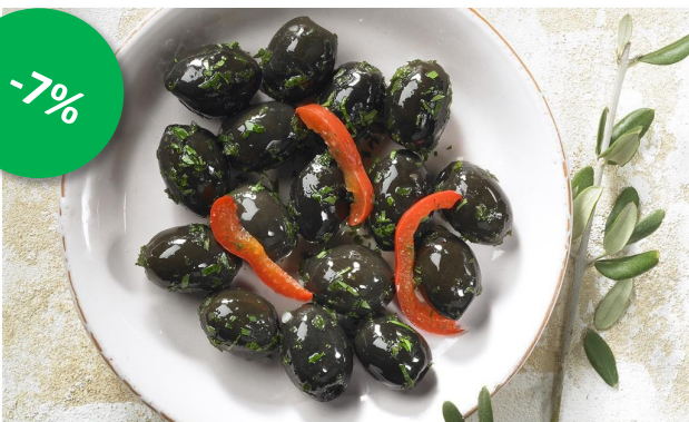
Fijne zwarte olijven 1,2kg Kulhmann