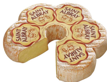
Saint albray 2kg week 26-27