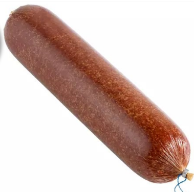
Primo Salami 3kg Week 23-24